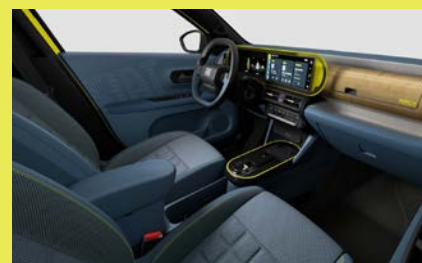
Sedadla čalouněná látkou La Prima, palubní deska čalouněná látkou Bambox (interiér 192, La Prima)