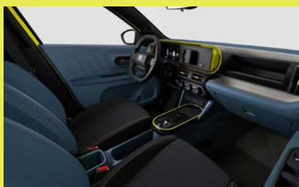
Sedadla čalouněná látkou Base (interiér 139, Pop a Icon)