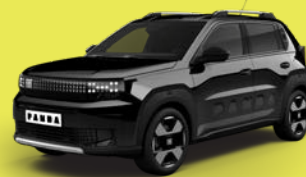
Černá Cinema (AC1-533)