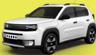
Bílá Gelato (B4R-240)*