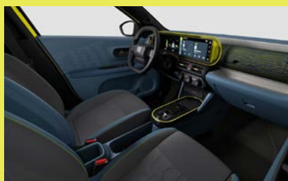
Sedadla a palubní deska čalouněné látkou Style (interiér 156, paket Style)