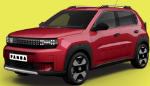
Červená Passione (BC7-111)*