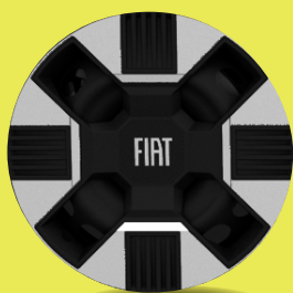
16" ocelová kola s dvoubarevnými kryty (D6J+D63, Icon)