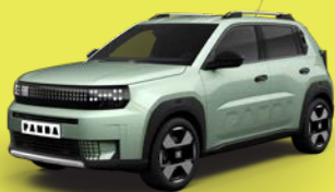
Azurová Acqua (BCA-368)*