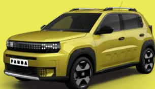
Žlutá Limone (BCU-507)*