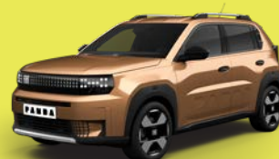
Bronzová Luna (BCL-724)*