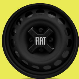
16" ocelová kola se středovými kryty (D6J, Pop)