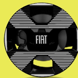
17" kola z lehkých slitin v broušené úpravě (D6M, La Prima)