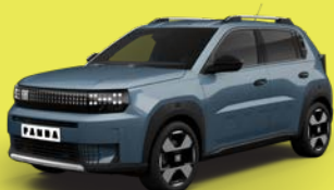
Modrá Lago (BCR-411)*