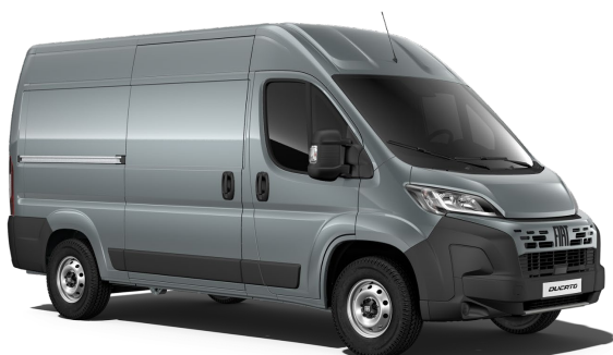
5CK 385 Šedá Lanzarote 21 000