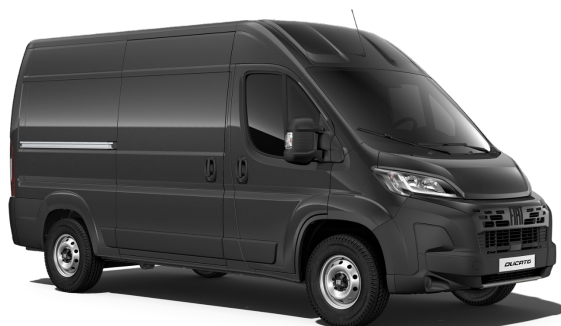
210 632 Černá Cinema 21 000