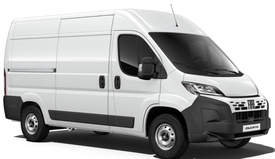
5DL 549 Bílá Gelato 0