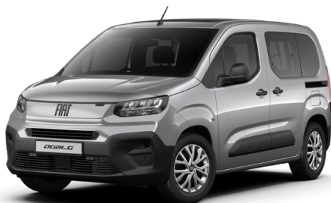
5DN 113 Šedá Maestro 12 000