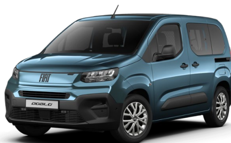
28C 528 Modrá Volare 12 000