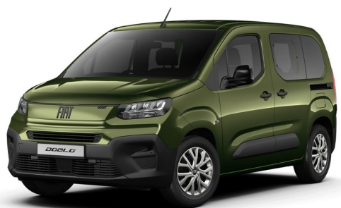
VJK 550 Zelená Toscana 12 000