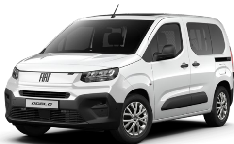
5DL 549 Bílá Gelato 0