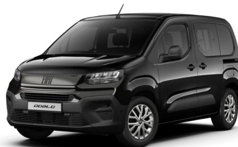
5DP 632 Černá Cinema 12 000