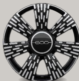
17" kola z lehkých slitin v broušené úpravě (1M2, Icon)