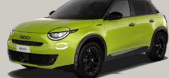
Zelená Acid + černá střecha (BCK - 846; pouze pro Sport)

*Pro výbavu La Prima a Sport k dispozici také s černou střechou