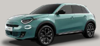
Modrá Sky of Italy* (5DN-959)