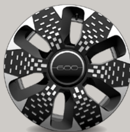
18" kola z lehkých slitin v broušené úpravě (1M5, La Prima)