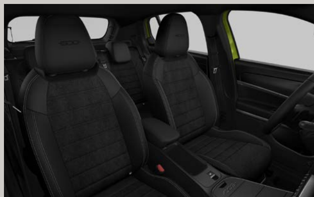
Sportovní sedadla čalouněná kombinací černé textilie Aunde Aulica a technokůže Feeltek (interiér 619, Sport)