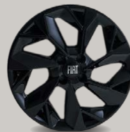
18" kola z lehkých slitin Sport v černém provedení (CW5, Sport)