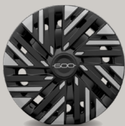
16" ocelová kola s dvoubarevnými ozdobnými kryty (1MW, Pop)