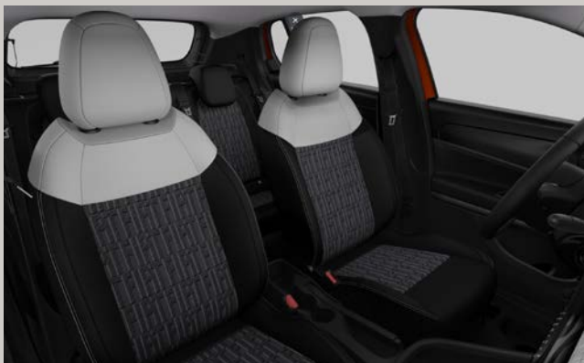
Sedadla čalouněná černou látkou Jacquard s monogramy Fiat a slonovinovými akcenty (interiér 822, výbava Pop; interiér 611, výbava Icon)