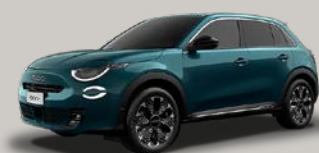
Zelená Sea of Italy* (52U-688)