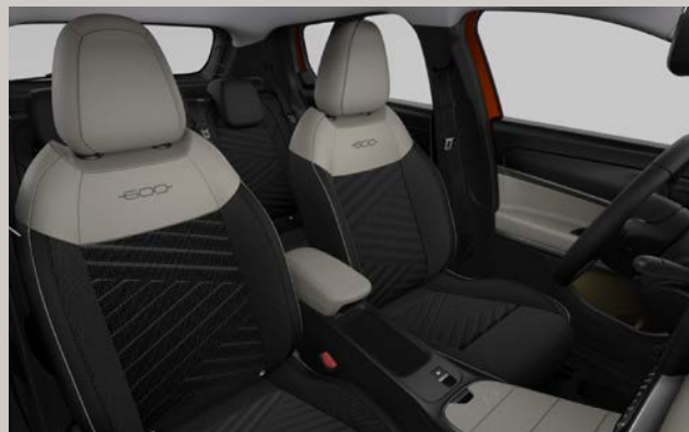
Sedadla čalouněná látkou Drive-In se slonovinovými doplňky (interiér 022, La Prima)