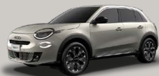
Písková Earth of Italy* (3YS-636)