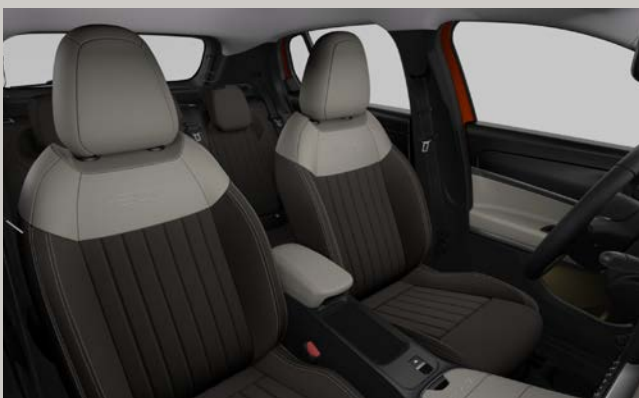
Sedadla čalouněná technokůží Feeltek se strukturovaným dekorem Cannelloni (interiér 569, La Prima)