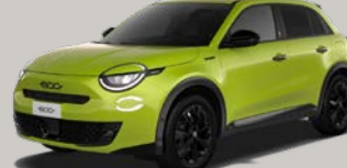
Zelená Acid (AJ3 - 352; pouze pro Sport)