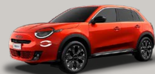
Oranžová Sun of Italy* (52T-572)