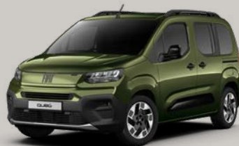
Zelená Toscana (VJK-550)