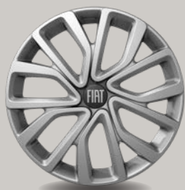
16" ocelová kola s ozdobnými kryty (3DA; Pop)