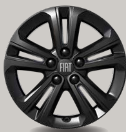
16" kola z lehkých slitin v černém provedení (3DB; Icon)