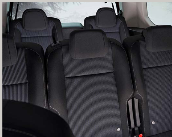
Černo-šedá látka s vinylovým pruhem na opěradle s logem Fiat (142)