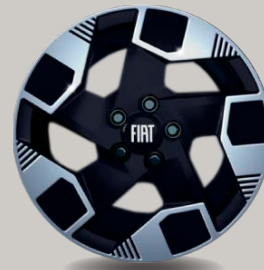
17" kola z lehkých slitin ve dvoubarevném provedení (3DC; Prima Rodina)