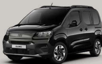
Černá Cinema (5DP-632)