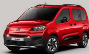
Červená Passione (JJP-182)