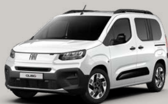
Bílá Gelato (5DL-549)