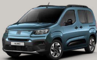
Modrá Volare (28C-528)