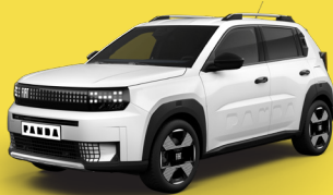
Bílá Gelato (B4R-240)