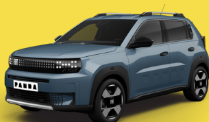
Modrá Lago (BCR-411)