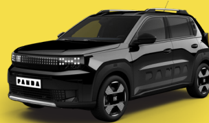
Černá Cinema (AC1-533)