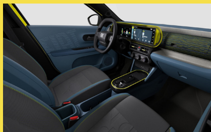
Sedadla a palubní deska čalouněné látkou Style (interiér 156, paket Style)