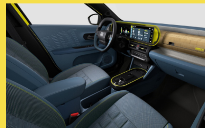
Sedadla čalouněná látkou La Prima, palubní deska čalouněná látkou Bambox (interiér 192, La Prima)