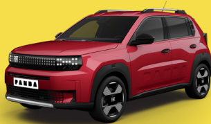
Červená Passione (BC7-111)