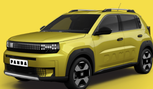
Žlutá Limone (BCU-507)