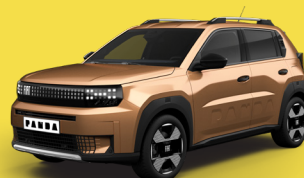
Bronzová Luna (BCL-724)