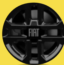
16" kola z lehkých slitin v černém provedení (D6L, paket Style)