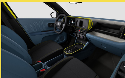
Sedadla čalouněná látkou Base (interiér 139, Pop a Icon)