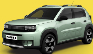
Azurová Acqua (BCA-368)